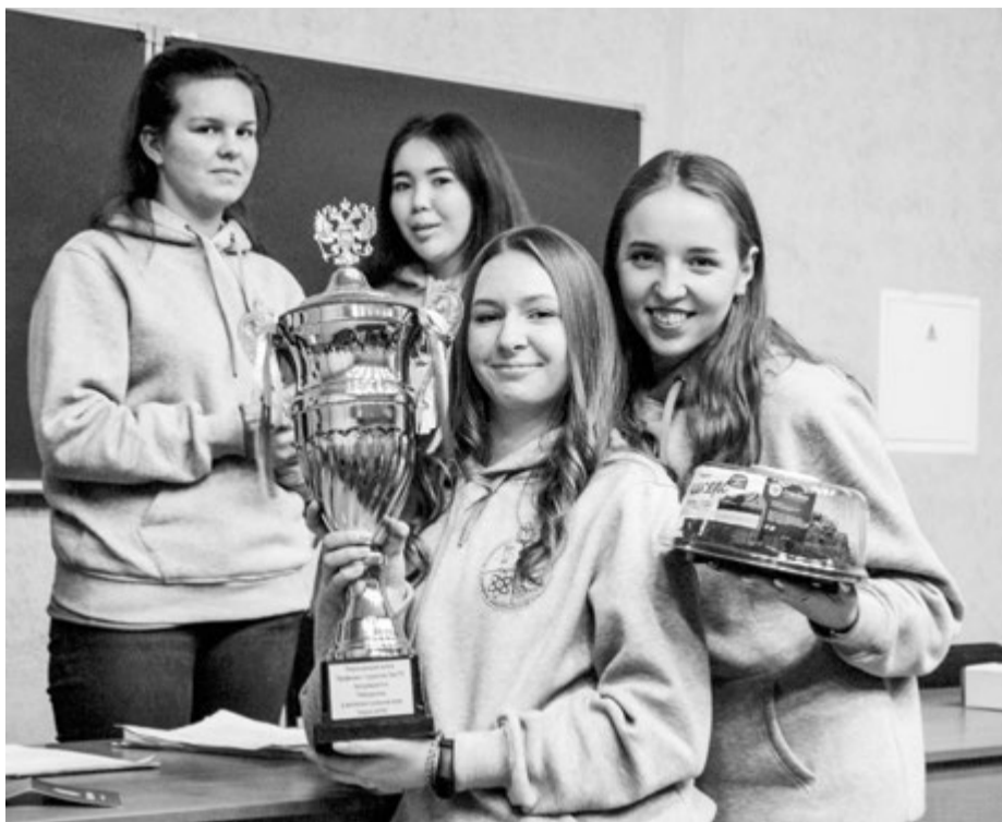
Всегда немало желающих принять участие в битве умов под названием «Наша игра», которая проводится в педуниверситете дважды в год

«Вы поедете на бал?» - этот вопрос в преддверии Дня российского студенчества во многих вузах страны становится актуальным. Правда, утвердительный ответ могут дать далеко не все. Участие в ректорских балах - большая честь, выпадающая лишь избранным. Во всяком случае, в Омском педагогическом университете это так. Умение танцевать вальс, мазурку или полонез здесь рассматривается только как дополнительное преимущество претендентов на участие. Основные критерии - достижения в учебе, спорте, творчестве, общественной деятельности. И нередко случается, что значительную часть «бомонда» на этом светском мероприятии составляют представители студенческого профактива. И это неудивительно, если учесть, что профком всегда находится в эпицентре вузовской жизни, «правит бал» во многих ее сферах.